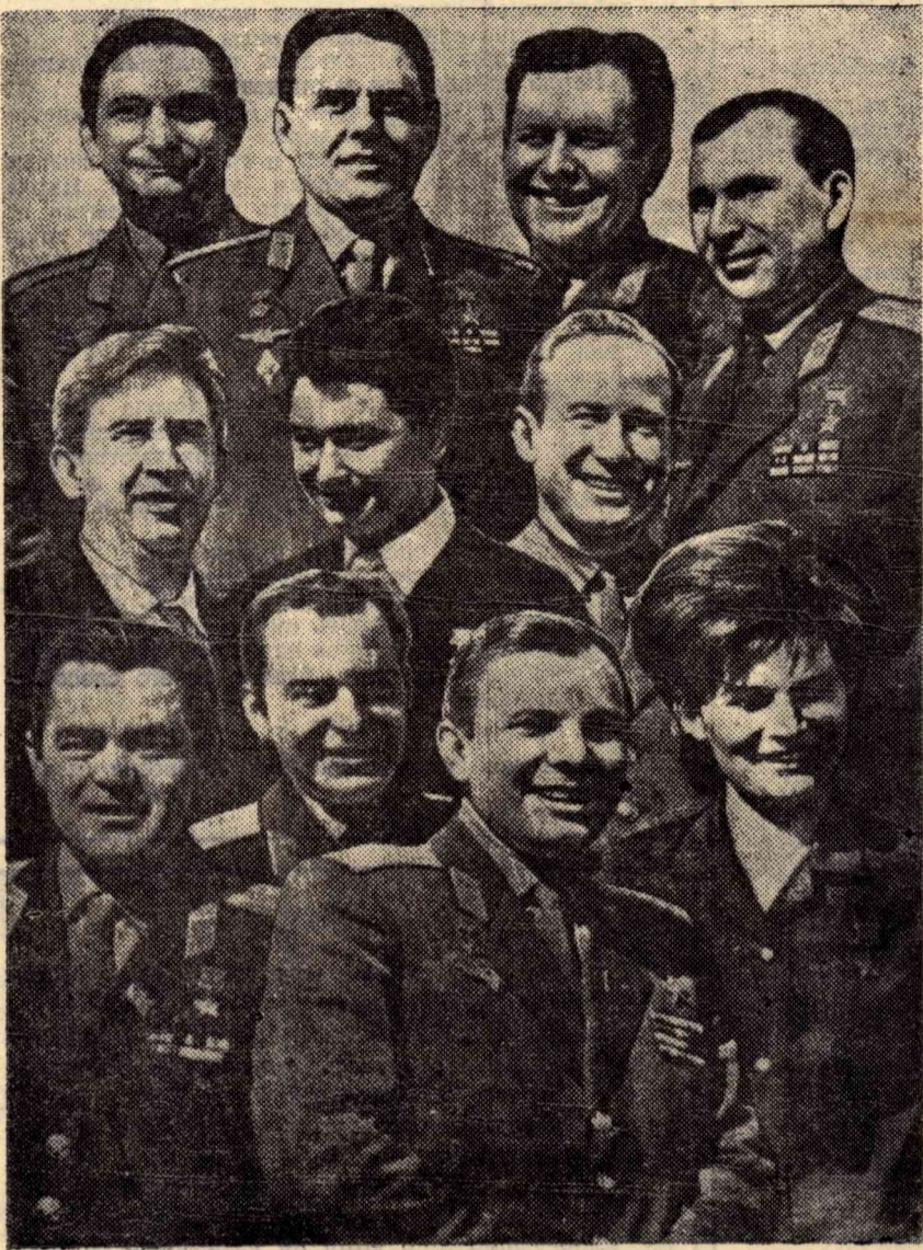
Вот она, славная семья советских космонавтов!