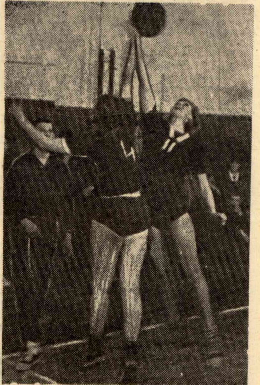
Первенство института по баскетболу. Встреча женских команд ТЭФ и ЭФФ.

ров. По решению спортивного клуба результаты эстафеты войдут в зачет куглогодичной комплексной спартакиады института. Команда-победительница награждается переходящим призом «За кадры», грамотой и годовой подпиской на газету, а члены команд — грамотами. Команда-победительница определяется по результатам трех эстафет. Начало соревнований в 11 часов.