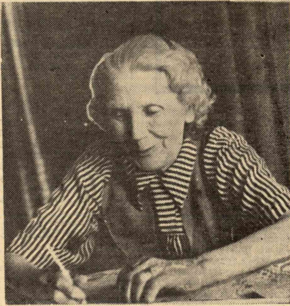
Делегаты представляли четырехсоттысячную армию комсомольцев. На многих были шинели, кожанки, папахи, картузы, кепи. В зале холодно. Моим соседом оказался балтийский моряк. Он внимательно слушал отчетный доклад секретаря ЦК

комсомола, а когда вопрос встал о защите социалистической родины, моряк сорвался с места и заявил: «Будьте спокойны, у нас контра не пройдет».