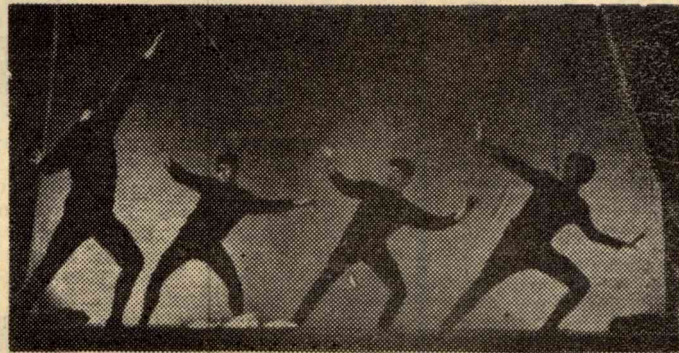
6 мая в Доме культуры ТПИ состоялся заключительный концерт коллективов художественной самодеятельности.