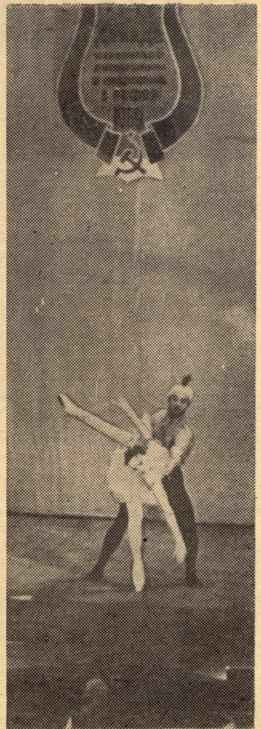
цев, сильных и мужественных людей.

Участники декады — гости с берегов Черного моря — подарили политехникам не только час хорошего настроения. В книге отзывов выставки ТПИ, где они побывали после окончания концерта, остались записи, полные любви и восхищения Сибирью, нашим великим и суровым краем, землей первопроходцев, искателей и рудознат-