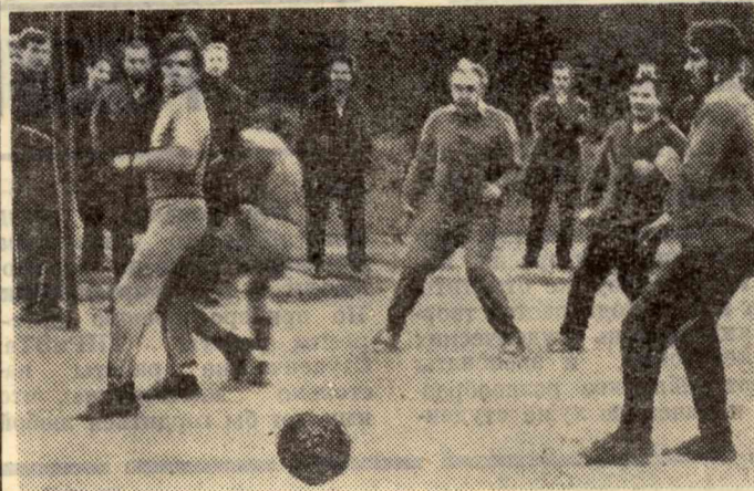
В НИИ электронной интроскопии ежегодно проводится футбольный турнир между секторами и отделами.