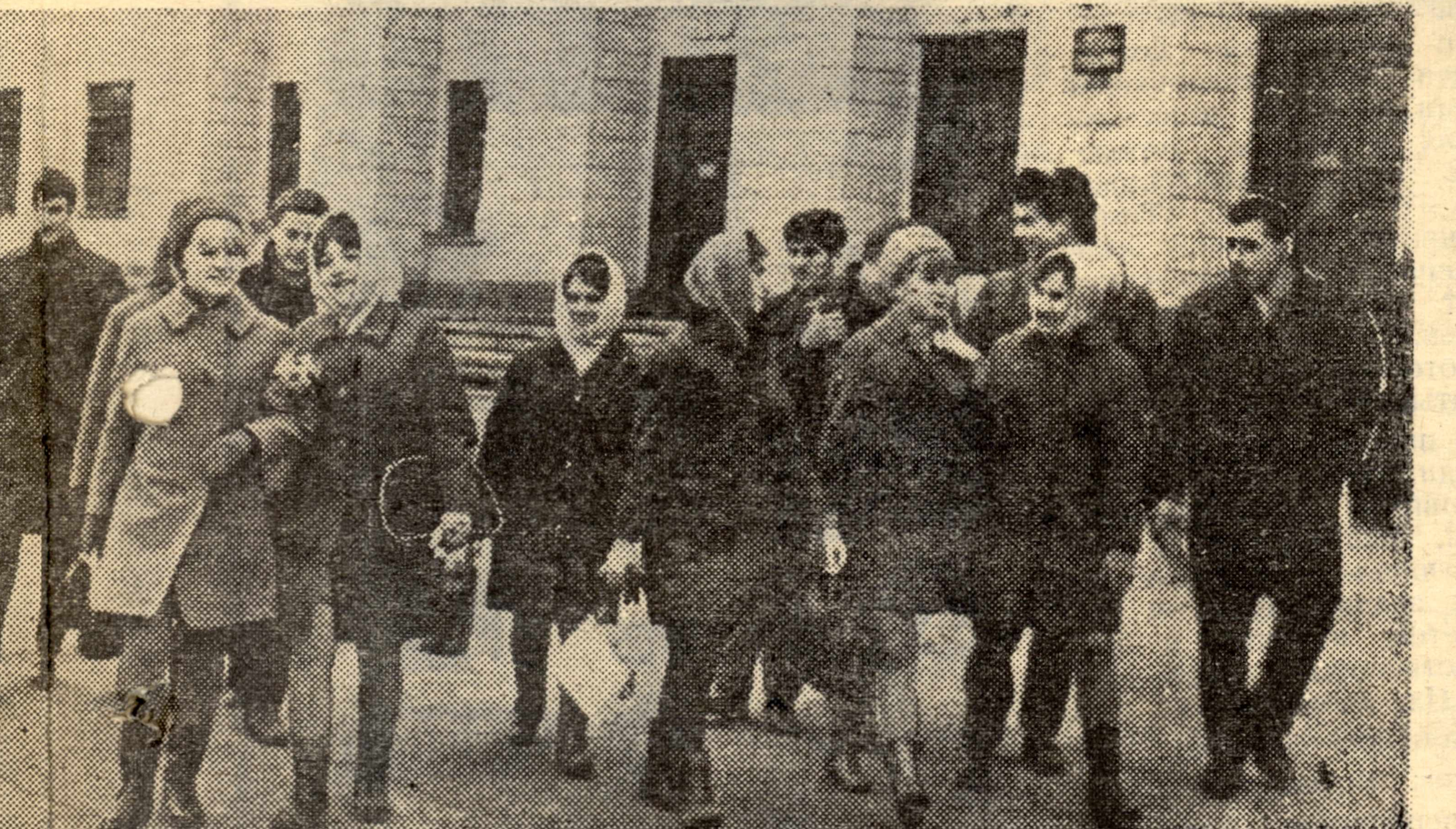
НА СНИМКЕ: студенты группы 1019—4, одной из лучших в институте, после занятий.

УРОКИ ТРУДОВОГО СЕМЕСТРА В этом году в строительных отрядах работало 1.610