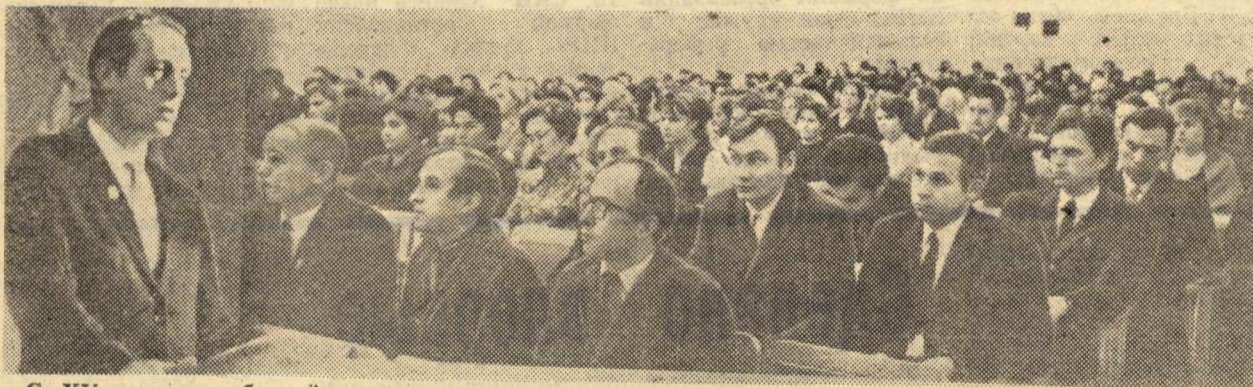
С XV отчетно-выборной профсоюзной конференции.