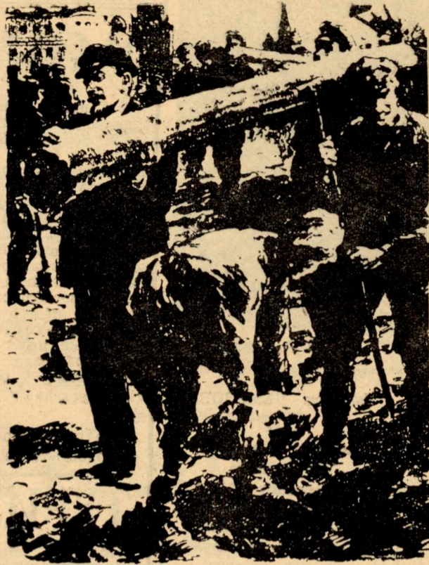
В. И. ЛЕНИН НА КОММУНИСТИЧЕСКОМ СУББОТНИКЕ В КРЕМЛЕ.