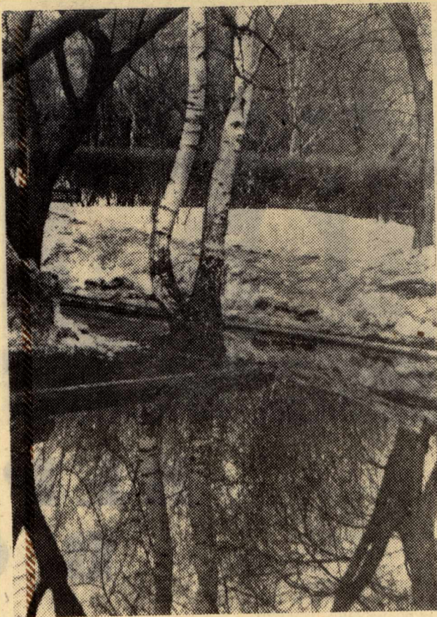
ВЕСЕННЕЕ. Фотоэтиюд ИШИНА. В.

Б. ШЕРСТОВИТОВ, комиссар оперативного отряда ДНД.