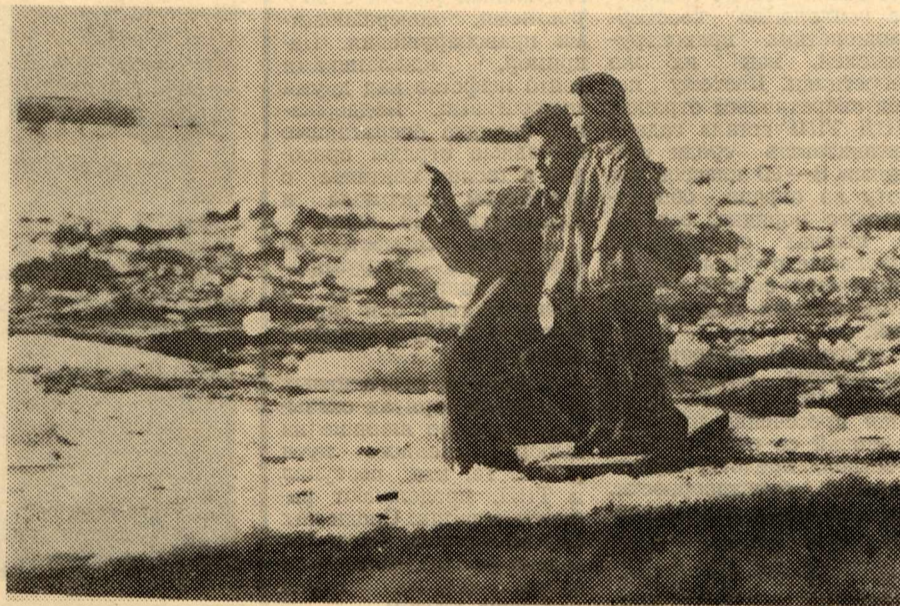
ЛЕБЕДИНАЯ ПЕСНЯ ЛЬДА.