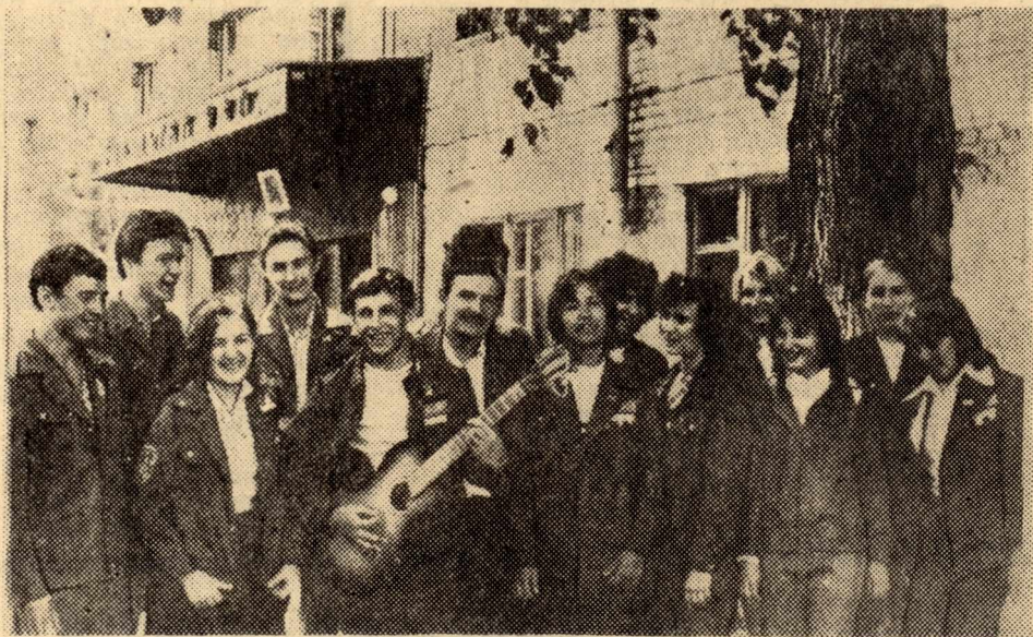
Бойцы ССО «Каникула» готовы к трудовому семестру.