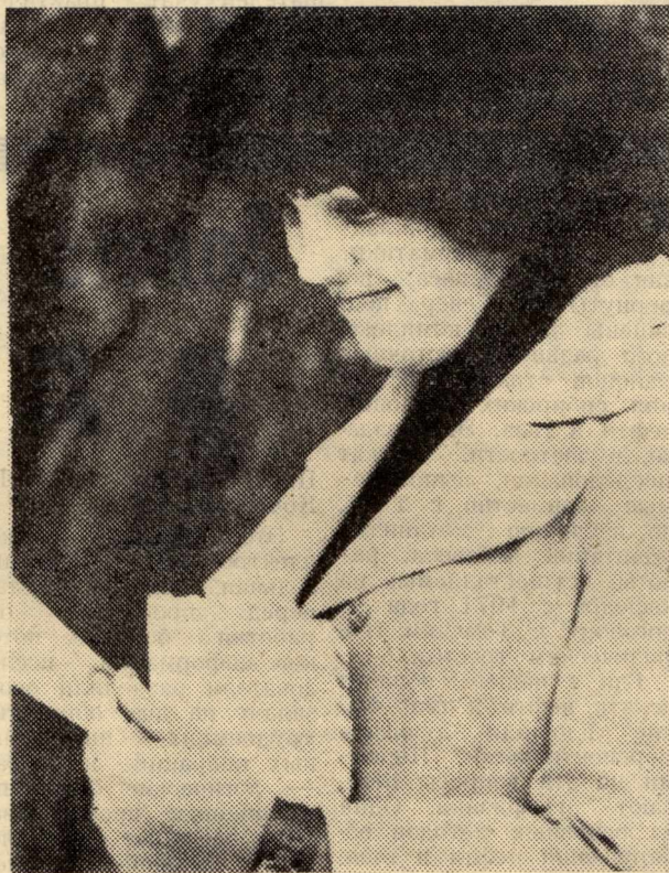
Письмо от мамы.