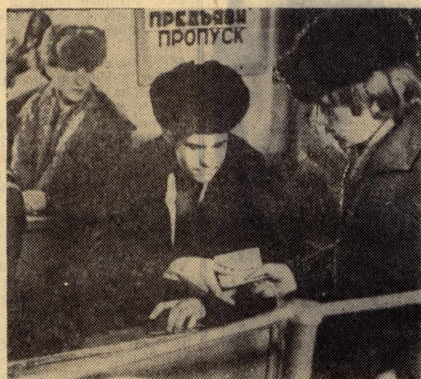
По инициативе комитета комсомола оперативники УОПФ 27 ноября проводили проверку пропускной системы в общежитиях на Кирова, 2 и Кирова, 56-б.

Еще острее реагировала на случившееся девушка, которая проживала в комнате пятой. Вбежав в комнату, она, кажется, назвала троих садистами. Ее можно было понять в ту минуту.