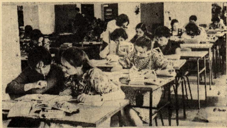
Самостоятельная работа с учебником в библиотеке — залог успешной учебы.