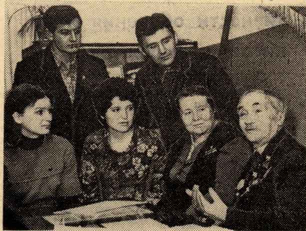
ВETERАНЫ ПАРТИИ, ТРУДА И КОМСОМОЛА ВСТРЕТИЛИСЬ НЕДАВНО СО СТУДЕНТАМИ АЭМФ И ХТФ.

этот ко мне с вопроса-ми. Голос добродушный, душевно-близкий. Как отец с сыном разговаривает. Как думаешь, спрашивает, одолеем мы врагов революции? Конечно, отвечаю. А их много, их 14 государств, говорит. А я ему, — а мы храбрее, мы их победим. А почему, задает он мне опять вопрос. Подумал я да и брякнул: а мы правильные. Засмеялся он и сказал твердо: верно, правое дело всегда победит! Разговариваем мы с ним, а я все жду, когда же Ленин-то появится. Вдруг секретарь входит и спрашивает: «Владимир Ильич, уже можно следующего приглашать?». Тут до меня и дошло: это я с Лениным разговаривал! Вскочил, хотел отдать рапорт, а Владимир Ильич улыбнулся, оставил меня, и опять пошел у нас разговор. Какие-то минуты говорили мы с ним, а сколько ценных замечаний он успел сделать! Хорошо помню его совет: надо учиться. Как учиться?—