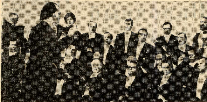
На прошлой неделе томичи восторженно встречали выступления Государственного академического мужского хора Эстонской ССР, концерты которого проходили в переполненных залах.