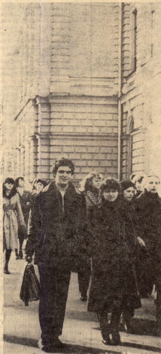
Профсоюзная организация ТПИ — самая многочисленная среди вузов города. НА СНИМКЕ, студенты спешат на занятия.