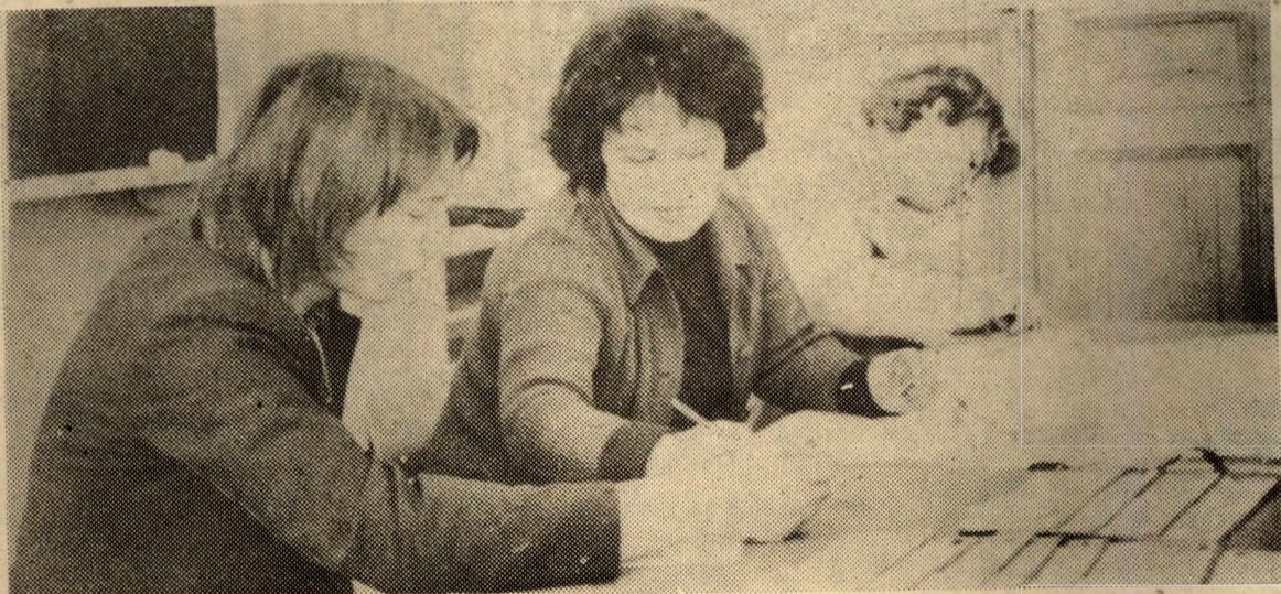
НА СНИМКАХ: ГРУППЫ 9203 И 6503 СДАЮТ ТЕОРЕТИЧЕСКУЮ МЕХАНИКУ. ПРЕДЕЛЬНОЕ ВНИМАНИЕ ПРЕПОДАВАТЕЛЯ К ОТВЕТАМ СТУДЕНТОВ, СОБРАННОСТЬ ЭЛЕКТРОЭНЕРГТИКОВ ОБЕСПЕЧИВАЮТ ДЕЛОВУЮ РАБОЧУЮ ОБСТАНОВКУ.