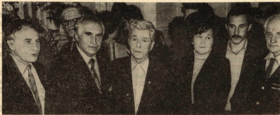
НА СНИМКЕ: в перерыве делегаты конференции обмениваются мнениями.

В институте создается обилие различных общественных организаций, растут штаты управленческого аппарата, но это не упрощает нашу работу. Увеличивается поток бумаг, количество отчетных показателей и заседаний. Следует поручить УНПК «Кибернетика» изучить систему управления в институте и внести деловые предложения, а заседать реже, готовясь к ним тщательнее.