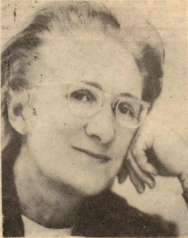
ГОРДОСТЬ ИНСТИТУТА — ЕГО ПРОФЕССОРА