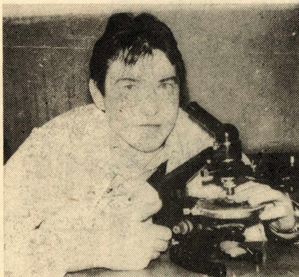
Современная наука и производство требуют от молодого специалиста не просто заученных, а глубоких и живых знаний, основанных на практике.

по генезису гранитоидов. Оба доклада получили высокую оценку слушателей и организаторов.