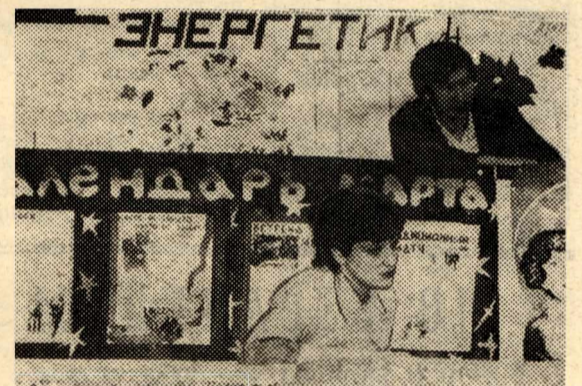
На конкурсе стеновых газет.