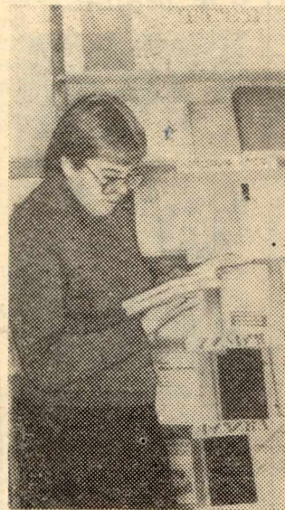
В научно-технической библиотеке оформлена выставка книг для первокурсников.