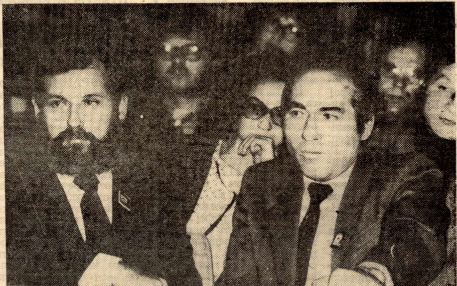
НА СНИМКЕ: в зале совещания