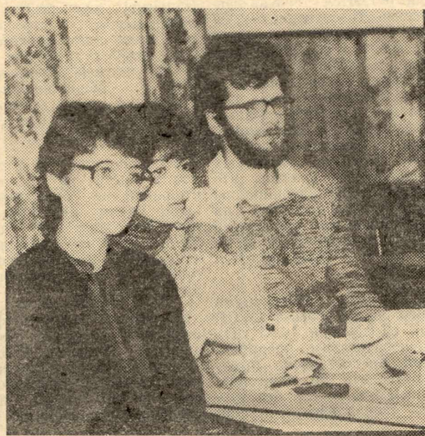
Активно работает в научно-технической библиотеке ТПИ клуб любителей искусств. Состоялось очередное его заседание.