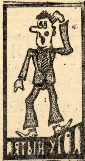
Рисунок А. Мальдсва.