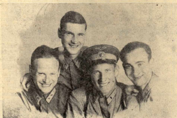
(Окончание. Начало в № 29).

И всюду — цветы, море цветов, переливавшихся разноцветьем. Местами раздавались возгласы, выражавшие высокий накал патриотических чувств, виднелись заплаканные лица пожилых женщин. Как и всюду в нашей стране, черкасцы отмечали 40-ю весну Великой Победы.