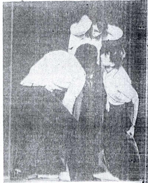
19 апреля в Доме культуры ТПИ состоялся концерт народного театра миниатюр. Коллектив народного театра познакомил зрителя с небольшими драмами, были показаны сценки из жизни студентов.