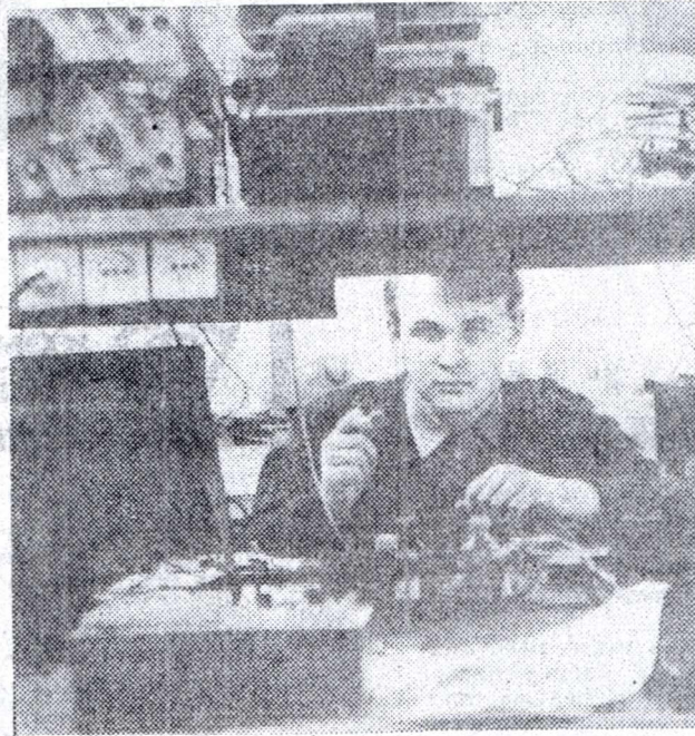
Студент гр. 7430