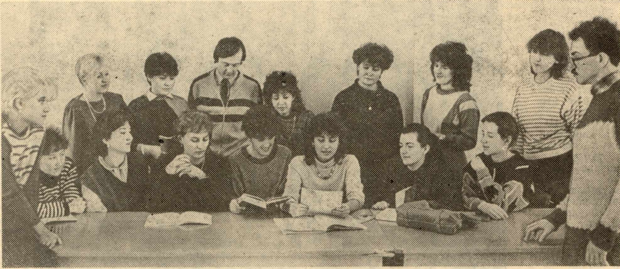
Перестройка высшей школы