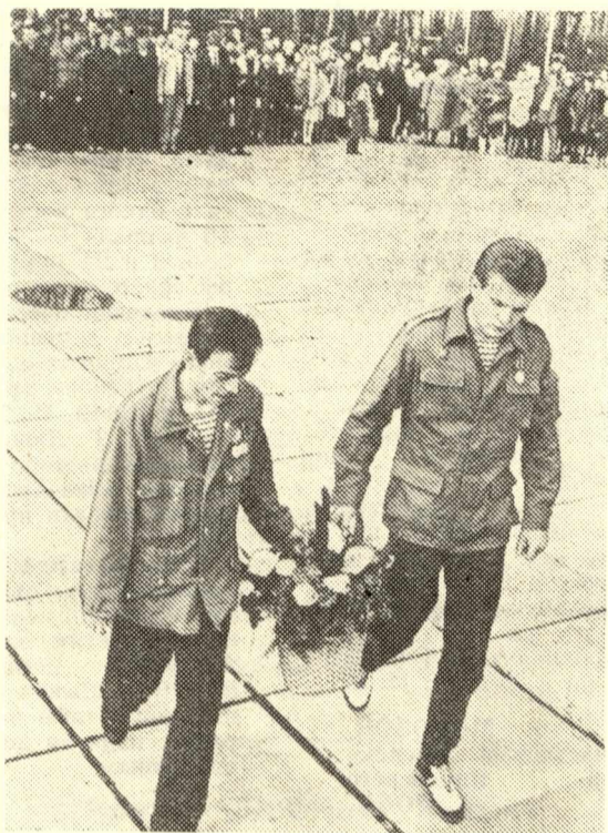
Перестройка вуза. Мнение

29 апреля в Лагерном саду у мемориала погибшим воинам-томячам состоялся митинг бывших воинов, выполнявших интернациональный долг в республике Афганистан. Митинг был посвящен десятой годовщине демократической революции в этой стране. У Вечного огня выступали и ветераны Великой Отечественной войны, и герои — наши современники. Минуту молчания почтили бывшие воины память погибших. К Вечному огню были возложены цветы — дань подвигу погибших.