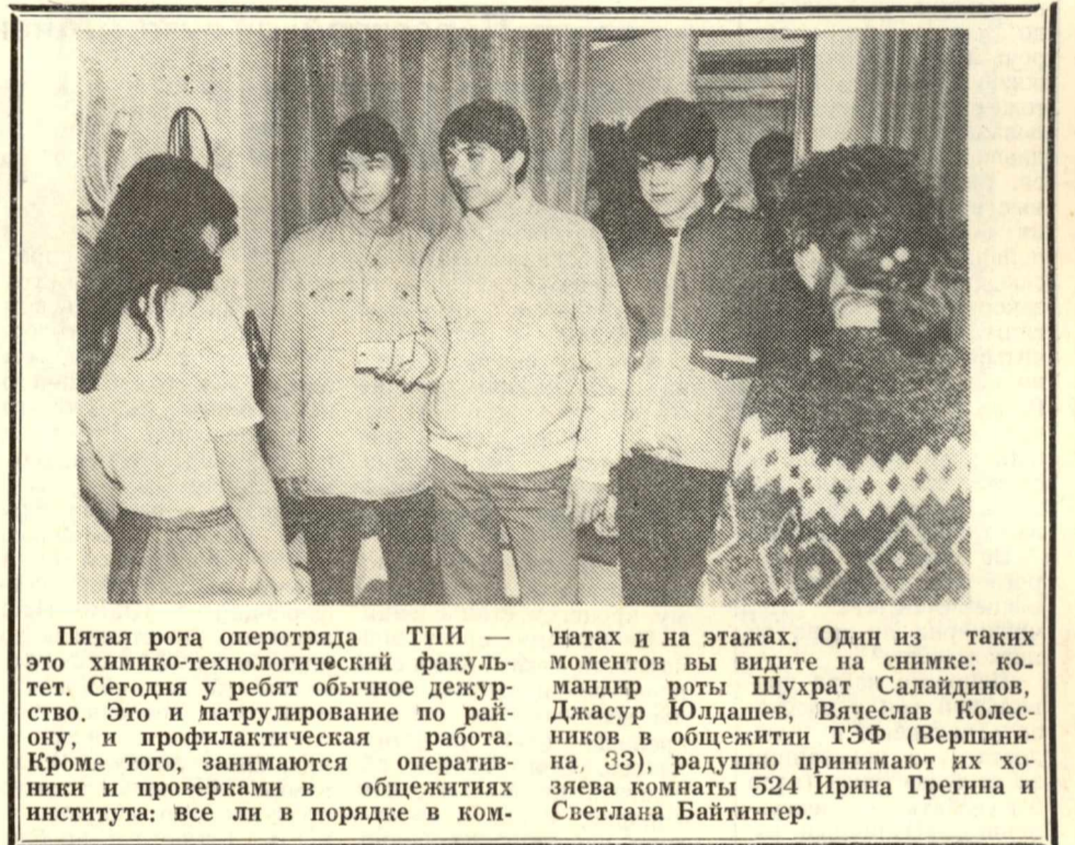
Пятая рота оперотряда ТПИ — это химико-технологический факультет. Сегодня у ребят обычное дежурство. Это и патрулирование по району, и профилактическая работа. Кроме того, занимаются оперативники и проверками в общежитиях института: все ли в порядке в ком-

Необходимо вести непримиримую борьбу с преступностью на почве пьянства, с самогонварением, наркоманией, нарушениями общественной дисциплины и порядка.