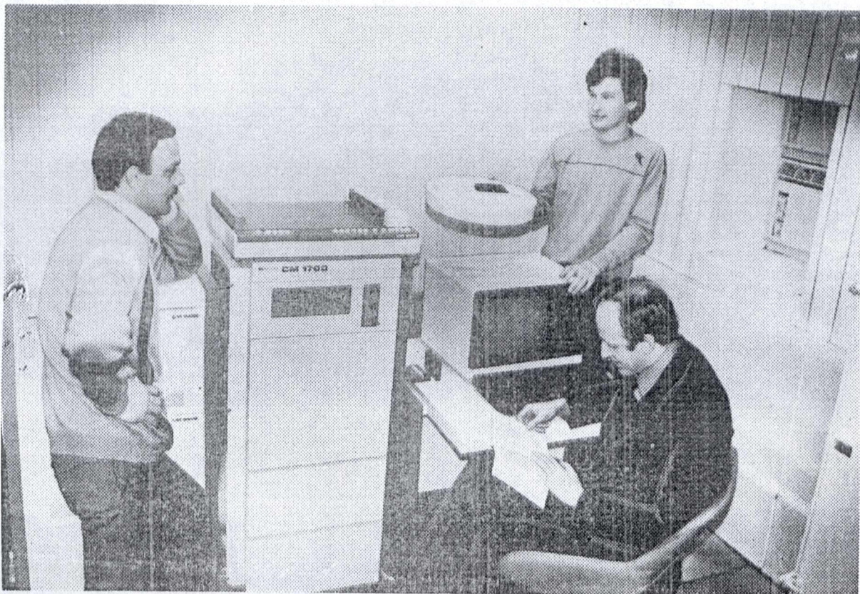
Новейшую вычислительную технику, поступившую в лабораторию кибернетического центра, осваивают молодые научные сотрудники УНПК «Кибернетика».

Авторы лучших работ будут поощрены. Конкурсная комиссия работает в комитете ВЛКСМ.