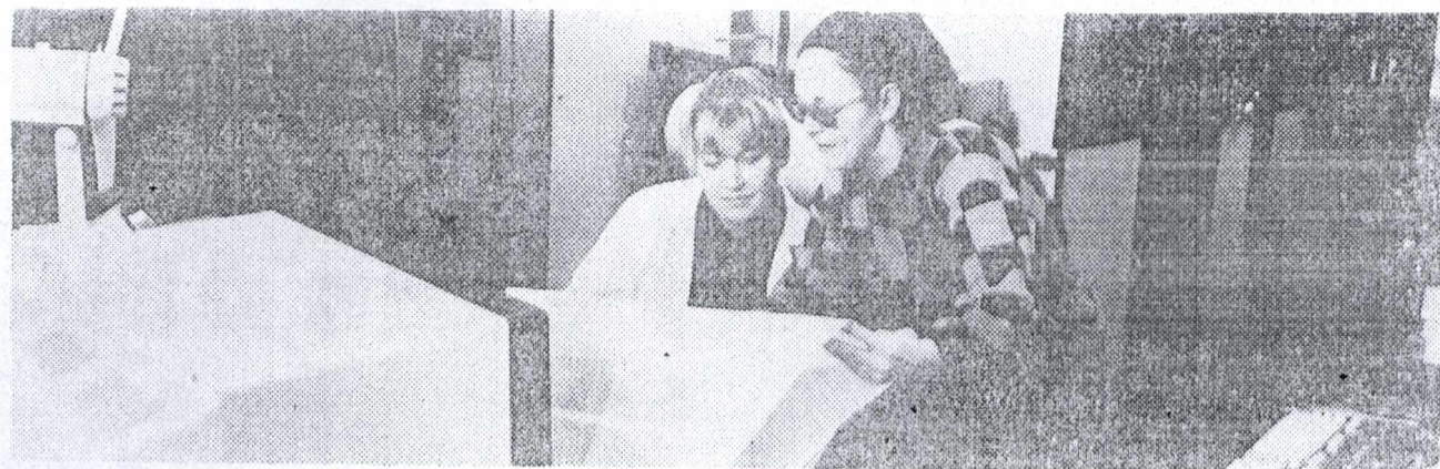
Заочная конференция читателей НТБ

«Роль библиотеки в формировании инженерной интеллигенции»