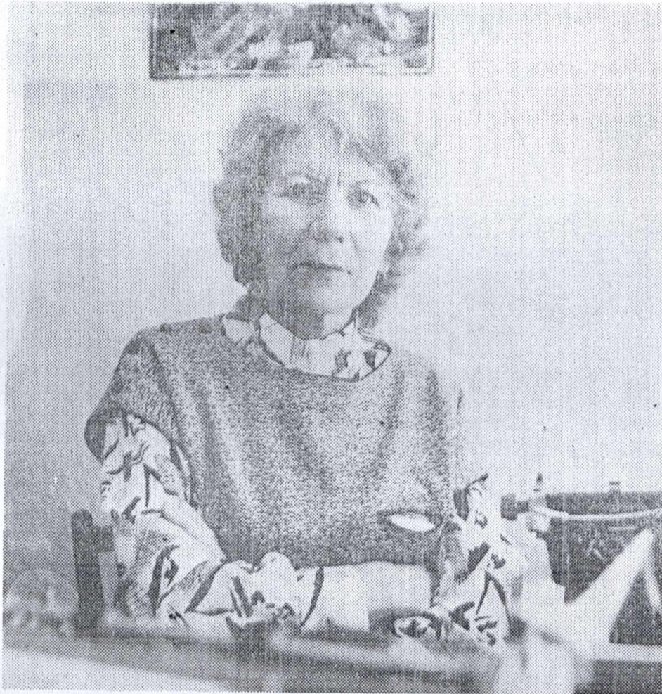
Из истории института