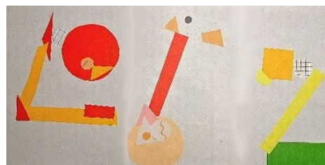
Рис. 2. Аппликации в стиле Мемфис

Наиболее визуально приятным по всем критериям (цвета, формы, назначение) дети предпочли образ настольной лампы в стиле Мемфис, потому что данный стиль динамичный, яркий и содержит в себе преобладание таких форм, как квадрат, треугольник и круг, что помогает создать разнообразие форм объекта при наличии небольшого количества фигур и цветов (рисунок 2).