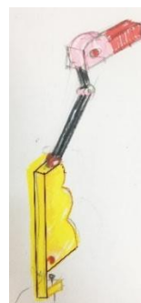
Рис. 5. Итоговый эскиз объекта

Следующим этапом в разработке настольной лампы являлось эскизирование. По завершении данного этапа, итоговым эскизом для создания трёхмерной модели был выбран эскиз, представленный на рисунке 5, так как он имел характерный бионический образ птицы фламинго и являлся ярким представителем стиля Мемфис.