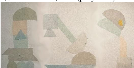
Рис. 4. Аппликации в Скандинавском стиле

Скандинавский стиль оказался менее предпочтительным из всех стилей в следствии изначально пастельного сочетания цветов, заложенного в данном стиле, однако при составлении данной аппликации дети были наиболее сосредоточены и осторожны с выбором цветов, производился тщательный поиск взаимодополняемых цветов (рисунок 4).