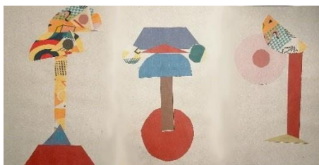
Рис. 3. Аппликации в стиле Ретро 70-х г.

Скандинавский стиль оказался менее предпочтительным из всех стилей в следствии изначально пастельного сочетания цветов, заложенного в данном стиле, однако при составлении данной аппликации дети были наиболее сосредоточены и осторожны с выбором цветов, производился тщательный поиск взаимодополняемых цветов (рисунок 4).