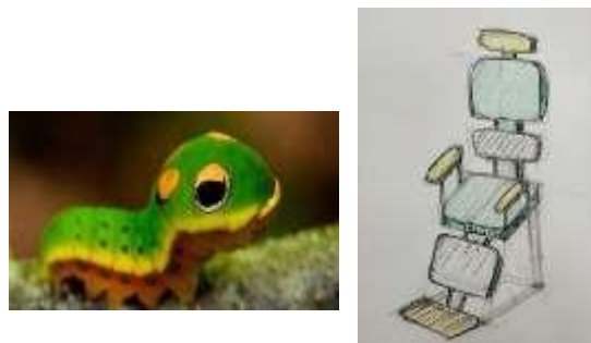
Рис. 3 Художественный образ гусеницы

концентрации внимания. Зеленый цвет- напротив обладает успокаивающим эффектом. В качестве третьего образа для эскиза кресла-опоры был взят образ гусеницы (рис.3).