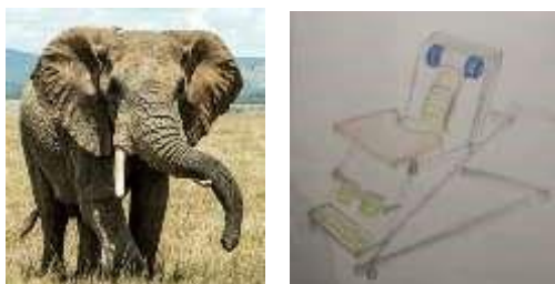
Рис. 2 Художественный образ слона

Основой художественного образа стала цельная форма, ассоциирующаяся с креслом космического корабля, скругленные формы, более гармоничные по сравнению с остроконечными, а также соответствующая тематике цветовая гамма. Колористика кресла-опоры была составлена, исходя из космической темы, а также с учетом необходимого психологического воздействия на пациента при использовании средства реабилитации [1]. Синий цвет- успокаивает нервную систему, способствует сосредоточению на учебной деятельности. Белый цвет-также обладает успокаивающим, но при этом мотивирующим эффектом. За основу второго художественного образа была взята тематика диких джунглей, тропических животных и растений, которая также активно привлекает пациентов детского возраста. В ходе разработки эскизного варианта было решено использовать образ слона, как миролюбивого животного, имеющего узнаваемые формы тела (рис.2).