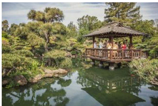
Рис. 1. Художественный образ «Чайная беседка»

Для реализации первой стадии дизайн-проектирования выставочного стенда чайной китайской компании выберем три художественных образа и на основе выбранных образов создадим три эскизных решения объекта. Первый художественный образ был назван «Чайная беседка». За основу данного образа было взято изображение старинной китайской беседки как представлено на рисунке 1.