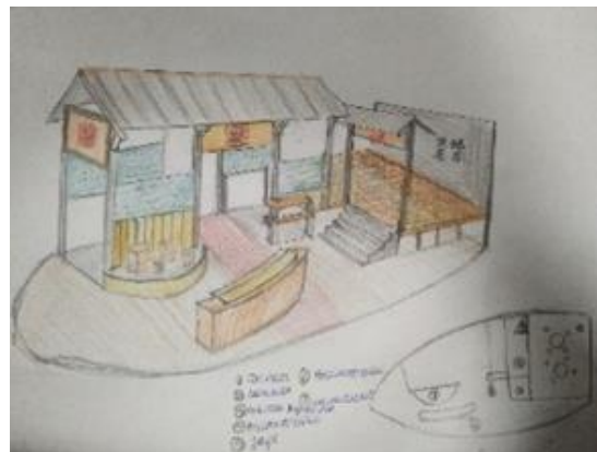
Рис. 2. Эскизное решение «Чайная беседка»

Представленный художественный образ говорит о традициях китайского чаепития, близкая к кубу форма беседки дает ощущение статичности, уверенности и покоя [3]. Присутствие неподвижной воды и растительности усиливает эти чувства. На основе данного образа было создано эскизное решение, представленное на рисунке 2.