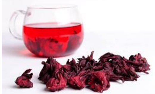
Рис. 5. Художественный образ «Красный чай»

Третий художественный образ был назван «Красный чай». За основу данного образа было взято изображение красного чайного листа чая как представлено на рисунке 5.