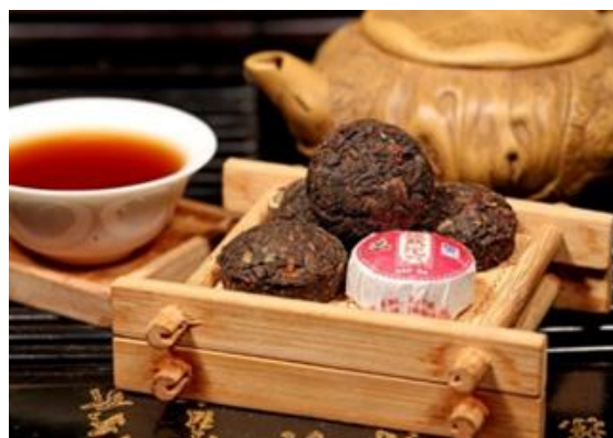
Рис. 3. Художественный образ «Чай Пуэр»

Второй художественный образ был назван «Чай Пуэр». За основу данного образа было взято изображение традиционного китайского чая «Пуэр» как представлено на рисунке 3.