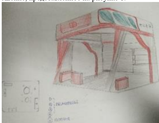
Рис. 4. Эскизное решение «Красный чай»

Пластика листьев чая символизирует движение и рост. Эти формы говорят о развитии. Красный цвет листьев бодрит и вызывает внимание [6]. На основе данного образа было создано эскизное решение, представленное на рисунке 6.