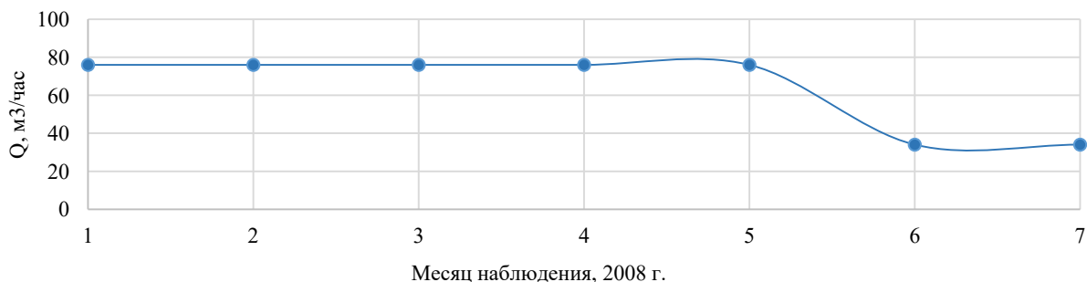
Рис. 2 Изменение дебита скважины № 15 в период с января по июль 2018 г.

В период с 1991 г. по 2001 г. не эксплуатировалась. Летом 2008 г. скважина была повторно остановлена на длительное время из-за резкого снижения дебита (рис. 2). Работа скважины была возобновлена в 2014 г. после проведения терморегентной обработки скважины, которая позволила вернуть значения удельного дебита на уровень 80-х годов XX века.