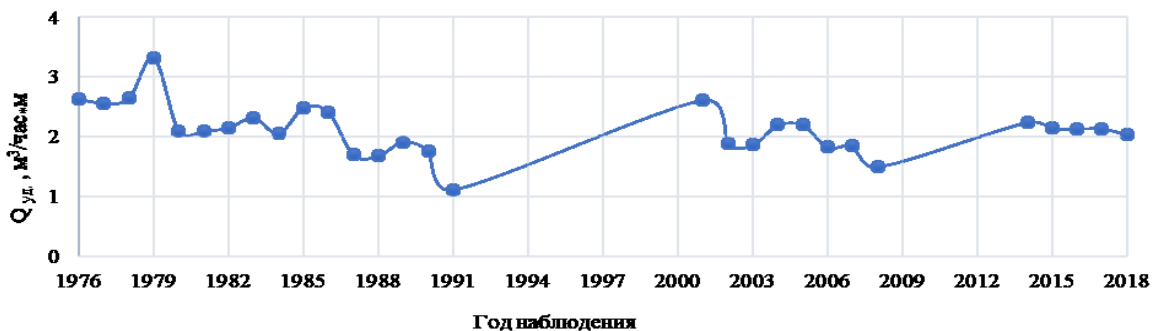
Рис. 1 Изменение удельного дебита скважины № 15 в период с 1976 по 2018 г.г.

На примере водозаборных скважин №15 и № 33 Томского водозабора можно проследить изменение их удельных дебитов на протяжении длительного периода времени в связи с отложением кольматирующих образований. Водозаборная скважина № 15 была запущена в эксплуатацию в 1972 г. (рис. 1).