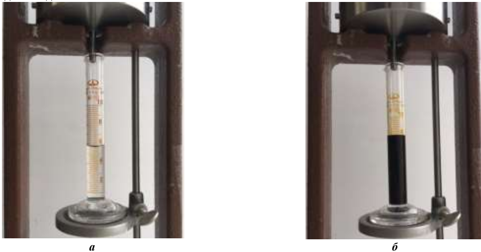
Рис. 1 «а»-фильтрация бурового раствора в «прямом» направлении. «б»-фильтрация флюида в «обратном» направлении

В данной работе были получены и исследованы модельные буровые растворы, формирующие адаптивную фильтрационную корку на стенке скважины, не пропускающую водную фазу фильтрата бурового раствора при первичном вскрытии продуктивного пласта, в то же время при вызове притока обеспечивающую свободное прохождение углеводородов (рисунок 1). На рисунке 1 «а» показан процесс фильтрации бурового раствора, имитирующий первичное вскрытие коллектора буровым раствором. Формируемая фильтрационная корка на стенке скважины является непреодолимым препятствием для свободного прохождения флюида при освоении скважины, поэтому в стандартной технологии ее удаляют кислотной обработкой призабойной зоны пласта. Однако нами предложена новая система биополимерного бурового раствора, при использовании которой углеводороды способны проходить через сформированную фильтрационную корку при вызове притока (рисунок 1 б). Видно, что корка такого типа бурового раствора не создает значительных капиллярных сопротивлений при фильтрации углеводородной жидкости.