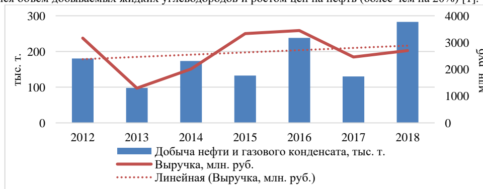
Рис.1 Динамика выручки компании от показателей добычи УВ

За период 2012-2018 годы наблюдается рост выручки компании, максимальное значение приходится на 2016 год (рисунок 1), что связано с девальвацией рубля, а также с высокими показателями добычи нефти и газового конденсата. Также наблюдается резкий скачок выручки компании в 2018 году по сравнению с 2017 годом в связи с увеличением объема добываемых жидких углеводородов и ростом цен на нефть (более чем на 20%) [1].