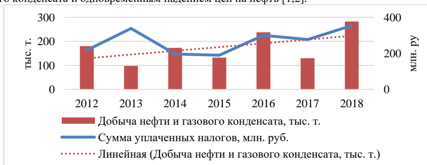
Рис. 2 Динамика уплаченных налогов и добычи УВ

За весь анализируемый период происходит рост суммарных уплаченных налогов (рисунок 2), однако в 2014-2015 годах наблюдается сокращение этого показателя в связи с относительно невысокими объемами добычи нефти и газового конденсата и одновременным падением цен на нефть [1,2].