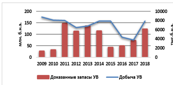
Рис. 1 Добыча доказанных запасов углеводородов PennVirginiaCorporation

EagleFord является крупным сланцевым нефтегазоконденсатным месторождением. Оно расположено на юго-западе штата Техас в США, общая площадь составляет 51,2 тыс. кв. км. Продуктивный пласт месторождения залегает на глубинах 1200-4200 м. Площадь нефтяной части 9,2 тыс. кв. км, толщина пласта 30-85 м. Средний дебит нефти или конденсата 19 т/сут, газа 13 тыс. м 3 /сут.