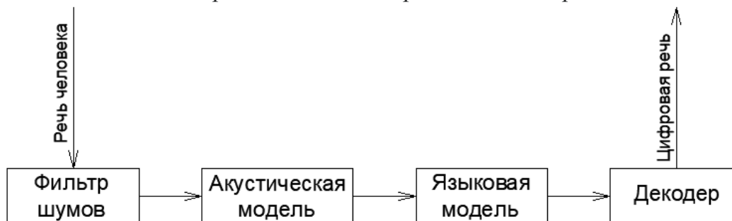
Схема работы системы распознавания речи

– Фильтр шумов необходим для устранения различных помех и шумов;