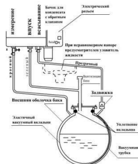
Рис. 2. Вакуумный детектор утечек

При установке вкладыша резервуар оснащается вакуумным детектором утечек (рис. 2), который предназначен для контроля герметичности резервуаров с двумя стенами, а также резервуаров с одной стенкой снабженных вакуумными вкладышами.