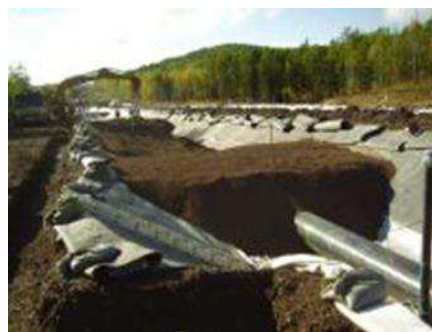
Рис. 1 Водонепроницаемые траншеи

Благодаря новым технологиям труба может двигаться под землей в случае сейсмических деформаций грунта и сохранить её в целости. Учитывая тот факт, что при сейсмических подвижках земной коры могут быть горизонтальные и вертикальные деформации грунтов, что возьмёт на себя роль в помощи предупреждения порывов трубопроводов и катастрофические последствия для природы.