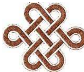
Рис. 1. Меандр

Разным орнаментам приписывали разные свойства и значения. Например, такой символ, как меандр (рис. 1), основанный на растительных и геометрических мотивах, у монголоязычных народов выражает идею вечного движения.