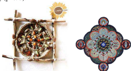
Рис. 3. Мандалы

Однако не все мандалы имеют круглую форму (рис. 3).