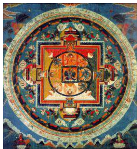
Рис. 5. Типичная форма мандалы

Типичная форма мандал – внешний круг, вписанный в него квадрат, в который вписан внутренний круг, который часто сегментирован или имеет форму лотоса (рис. 5) [4].