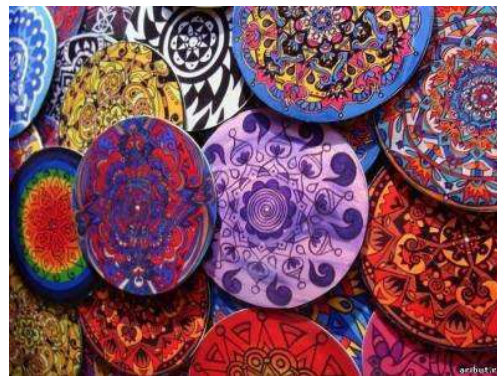
Рис. 7. Мандалы

Психологи идентифицируют мандалу как символ человеческого совершенства – ныне она используется в психотерапии в качестве средства достижения полноты понимания собственно-го «я» (рис. 7).