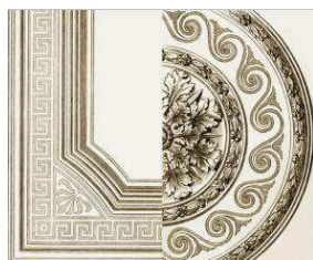
Рис. 2. Плетенки