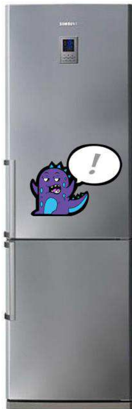
Рис. 7. Использование магнита и его примерный размер

На рисунке 7 показано использование магнита и его примерный размер.