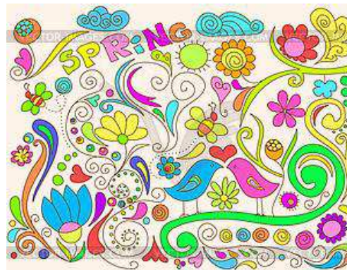
Рис. 2. Анализ по размещению рисунка на бумаге

А если человек стремится занять все пространство на бумаге (рис. 2) – автор узоров превозносит свой статус, компенсируя чувство неуверенности.