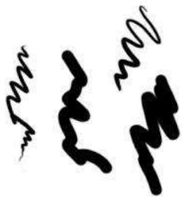
Рис. 3. Анализ по нажиму

Сила нажима. С помощью нажима можно оценить характер внешних эмоционально-волевых проявлений автора (рис. 3).