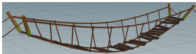
Рис 2. Модель канатного моста.

редактировать это – степень провисания, минимальный и максимальные углы поворота досок, количество досок присевающих на мосту, а также их размер. Параметр размера, поворота и количества досок генерируется случайно исходя из ограничивающих параметров и параметра начальной генерации (Seed). Модель канатного моста представлена на рисунке 2.