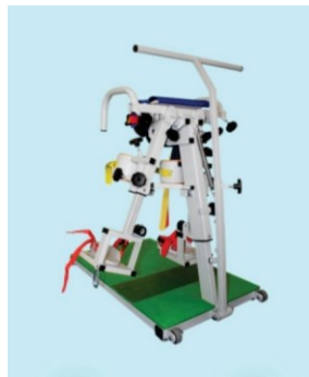
Рис. 3. Ортезная система [4].

С точки зрения функционала, в «ортезной системе» представленной на рисунке три заметно прослеживается тоже конструктивное устройство скелета человека — это основная несущая стойка и установленные на неё движущиеся элементы кроме того в рассматриваемом оборудовании используются элементы рычага, что является принципом бионики. Принцип рычага используется в опорно-двигательной системе человека. Он состоит из двух костей, соединённых суставом, и из мышцы, прикреплённой к этим костям, представляющие собой простой рычаг. В природе рычаг можно заметить в строении деревьев, чем больше корни в земле, тем устойчивее дерево. С точки зрения визуального восприятия изделие выглядит достаточно тектонически продуманным что характерно живым организмам, то есть в его конструкции наблюдается взвешенный выбор количества материала.