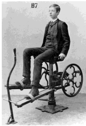
Рис. 2. Аппарат Густава Цандера (1835-1920) [3].