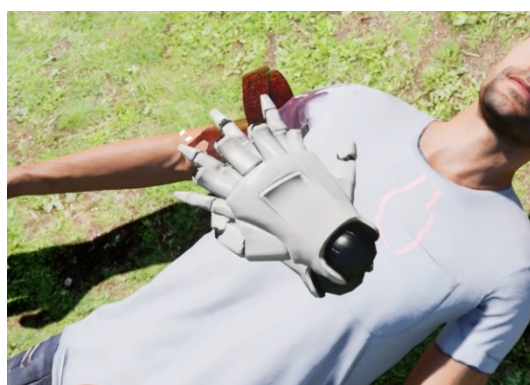
Рис. 4. Проведение СЛР