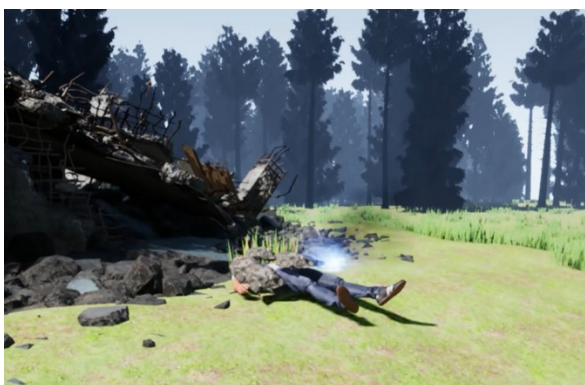
Рис. 3. Локация

Основным объектом на сцене является пострадавший человек. С ним связано основное взаимодействие данного тренажера. В данном объекте реализованы алгоритмы: учет камней, проверки пульса и дыхания, проверка целостности костей, поворот головы и проведение СЛР.