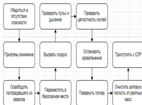
Рис. 2. Правильный алгоритм действий