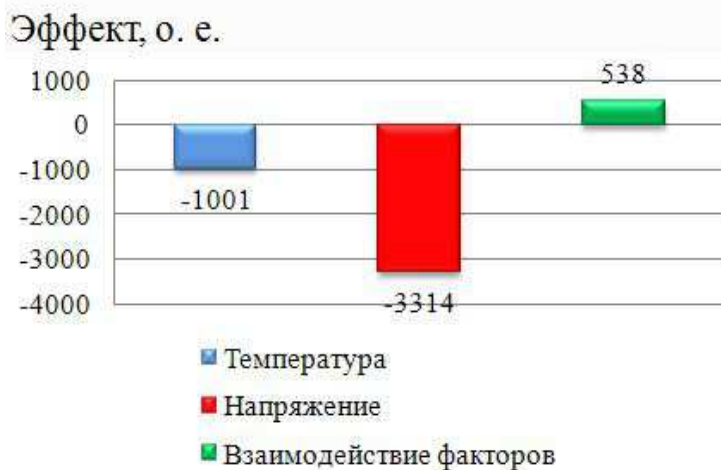
Рис. 2. Эффект факторов

На каждый уровень температуры было испытано по пять образцов, дисперсионный анализ результатов испытаний показал незначительный вклад температуры в процессы старения и разрушения изоляции при воздействии высокочастотных импульсов.