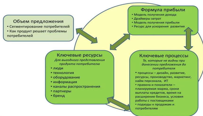
Рисунок 1 – Структура бизнес-модели

Популярные виды бизнес-моделей, которые доказали свою эффективность: