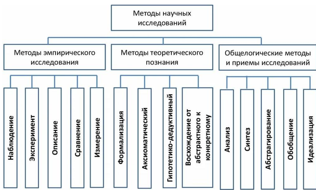
Рисунок 3 – Методы исследования

Методы исследования - это особые процедуры сбора и анализа данных для проведения анализа и расчета коэффициентов. Применяемые в выпускной квалификационной работе методы представлены на рисунке 3