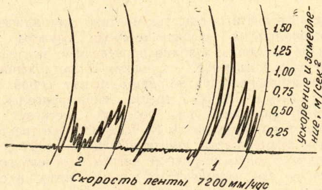
Рис. 2. Диаграммы ускорений (1) и замедлений (2) скиповой подъемной установки шахты «Капитальная-1» треста «Осинникиуголь»

нального момента двигателя, на клетевом подъеме шахты «Физкультурник» — 56% и на клетевом подъеме шахты № 2 — 45%. На многих подъемных установках имели место большие ускорения в период выбирания свободного напуска каната (скиповой подъем шахты им. С. М. Кирова, треста «Ленинуголь», Северный скиповой подъем шахты