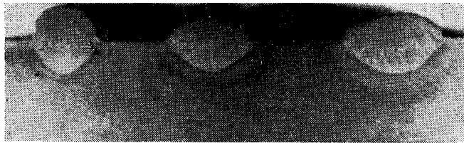
Рис. 2. Форма шва и характер проплавления при увеличении длительности импульсов

Влияние частоты следования импульсов на глубину проплавления, ширину шва и высоту усиления показано на рис. 1, а. Форма шва и характер проплавления при изменении длительности импульсов тока показаны на поперечных макрошлифах (рис. 2).