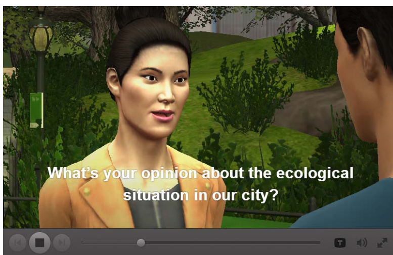
Рис. 2. Видеоролик, созданный с помощью приложения Plotagon, на тему «Окружающая среда»

Видеоролик, созданный с помощью Plotagon, помог в моделировании такой коммуникативной ситуации, как диалог на тему «Окружающая среда».